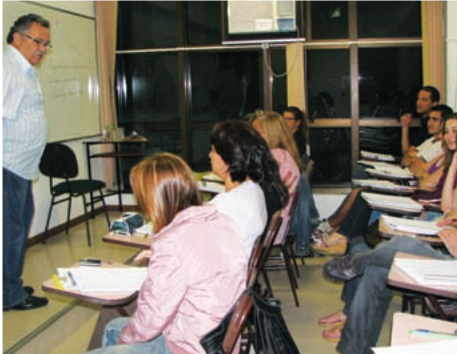
A escola Nani está há 17 anos no mercado e o número de aprovações em vestibulares tem crescido anualmente