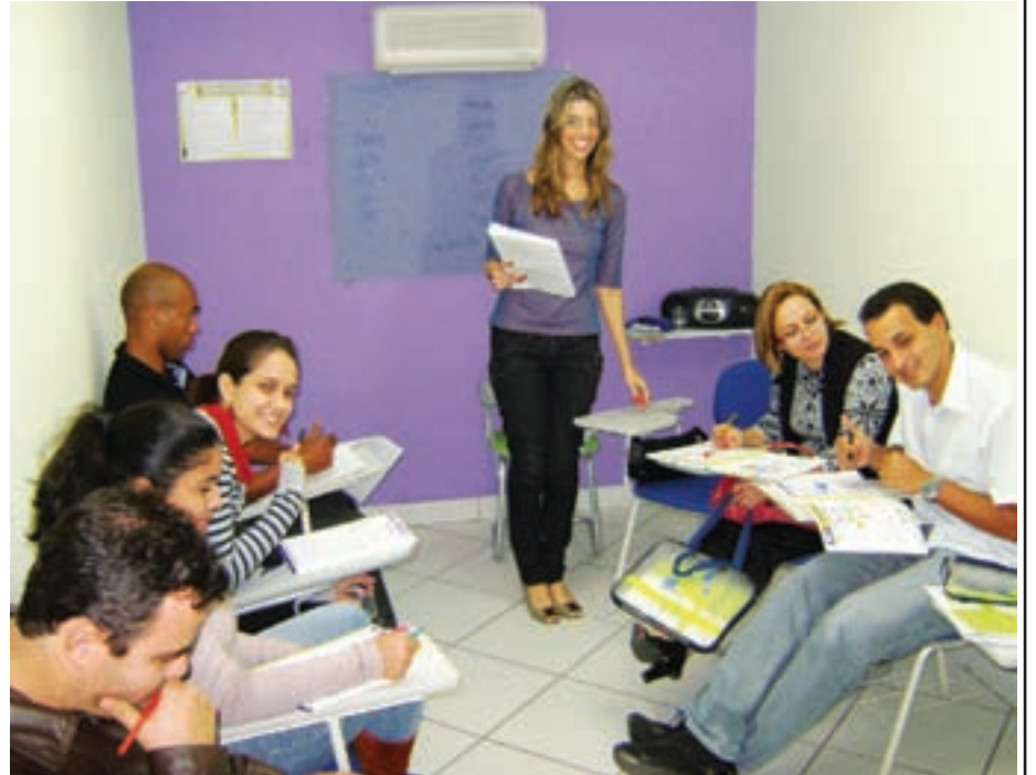
Ao final do quinto módulo de ensino, os alunos da inFlux recebem um certificado de proficiência internacional, o TOEIC

Com esta metodologia diferenciada, a inFlux garante fluência ao final do quinto módulo e o aluno recebe um certificado do TOEIC (Test of English for International Communication). Dessa forma, ao final do curso, que tem duração de 2 anos e meio, o aluno adquire um Certificado Internacional, que comprova proficiência no idioma.