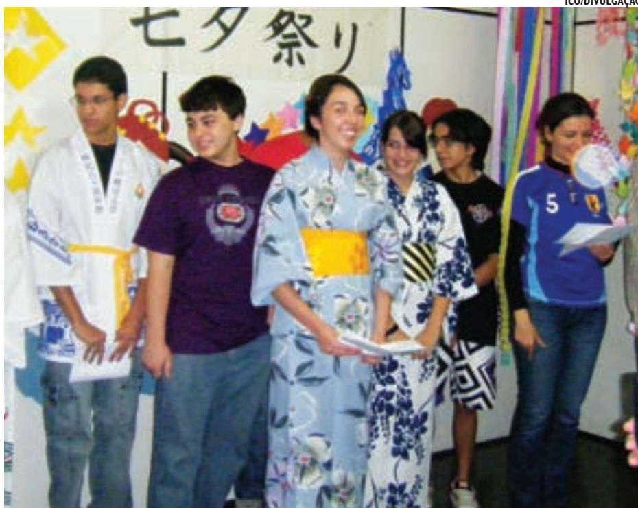
Mais do que aprender a língua japonesa, os alunos têm oportunidade de imergirem na cultura do país do sol nascente

“Mais do que uma escola de idiomas, nossa escola é uma instituição que ensina a cultura nipônica de um modo em geral. Complementamos o ensino com músicas, filmes, eventos culturais e