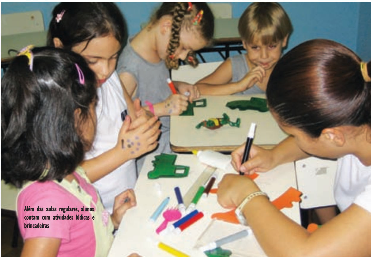
Além das aulas regulares, alunos contam com atividades lúdicas e brincadeiras

• Converse com pais de alunos que já frequentam a escola.