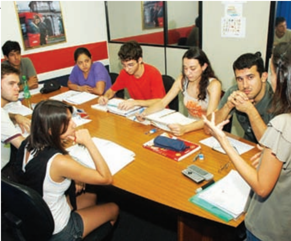
Turmas reduzidas, material didático importado e aulas de cinco idiomas diferentes são alguns dos atrativos da escola The Best

Imagine pagar um valor fixo por mês por um curso de informática e poder assistir a quantas aulas quiser. A ideia, que pode parecer absurda para alguns, é a grande aposta da escola The Best Idiomas e Informática. Com uma metodologia exclusiva de treinamento