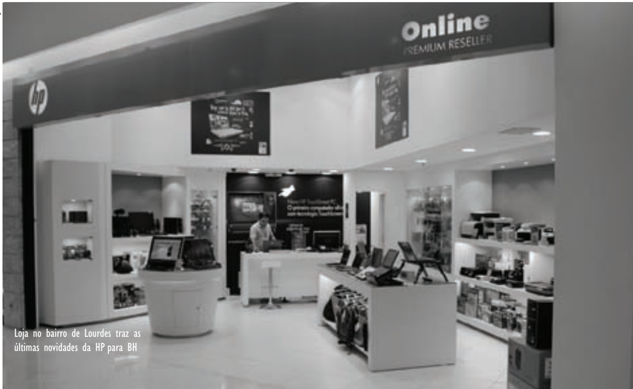
Loja no bairro de Lourdes traz as últimas novidades da HP para BH